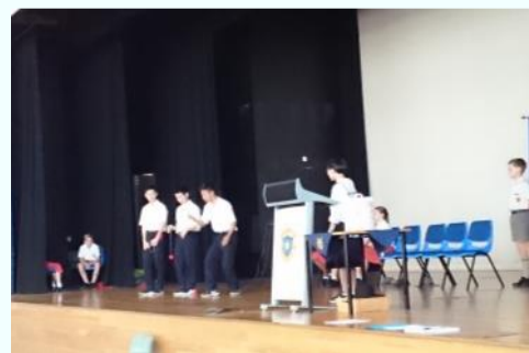
歓迎会でのけん玉パフォーマンス