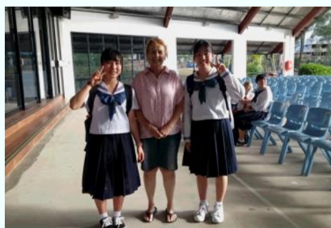
ホストファミリーとの対面

留学を終えた生徒は、「語学力の成長はもちろん、実際に異文化に触れることで日本の良し悪しも分かり、考え方、価値観の広がりを感じることができた」と、様々な面で自身の成長を感じることができた様子でした。