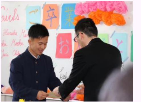
最後のLHRで卒業証書を手にする卒業生

最後のHRを終えた卒業生は、「中学校までと異なり、多様な考え方の人とたくさん交わる中で人間的に成長できました。」と三年間を振り返り、後に続く71・72期生の後輩に向けても「自分が頑張ったことは無駄にならない。諦めずに前を向いて学校生活を頑張してほしい」とエールを送ってくれました。