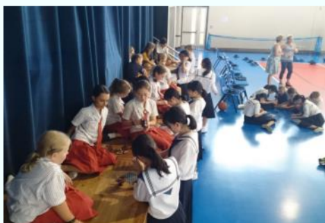
ジュニアクラスの小学生との交流