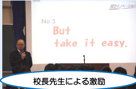
校長先生による激励