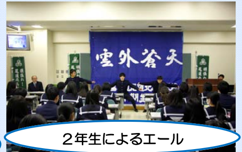
2年生によるエール

校長先生、進路指導主事、3学年主任、2年生応援団生徒によるエール…とたくさんの激励・応援があり、センター試験を皮切りに、本格的に受験がスタートする3年生にとって大きな支えとなったようです。